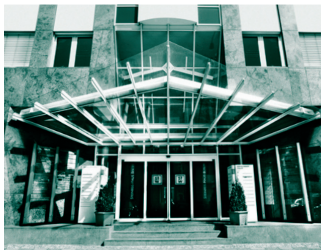
Das Steinbeis-Haus in Berlin – Hauptsitz der Steinbeis-Hochschule

Staatlich anerkannter akademischer Grad – Master of Business Administration (MBA)