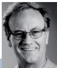
1 Dieter Brandes Ehem. ALDI-Top-Manager und internationaler Unternehmensberater

Einfach managen. Klarheit und Verzicht – der Weg zum Wesentlichen.